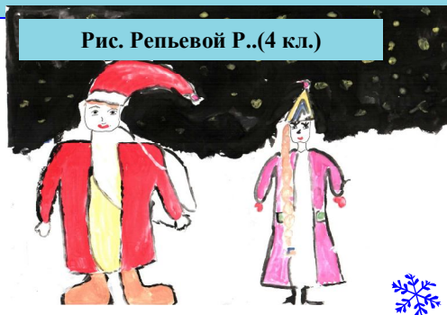
Рис. Репьевой Р..(4 кл.)