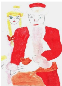
Рис. Грушникова Ж..(4 кл.)