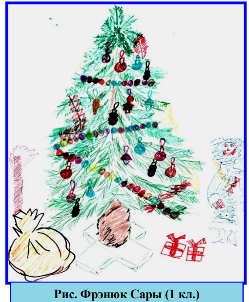
Рис. Фрэнюк Сары (1 кл.)