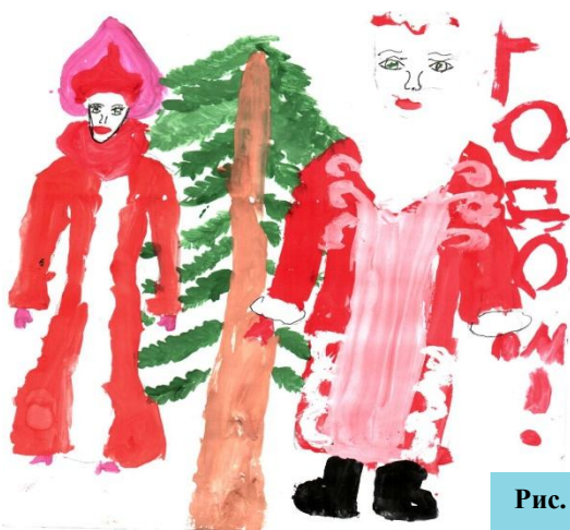
Рис. Гвоздковой А.(4 кл.)