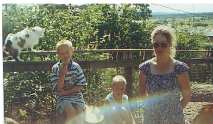
Наша мама лучше всех!